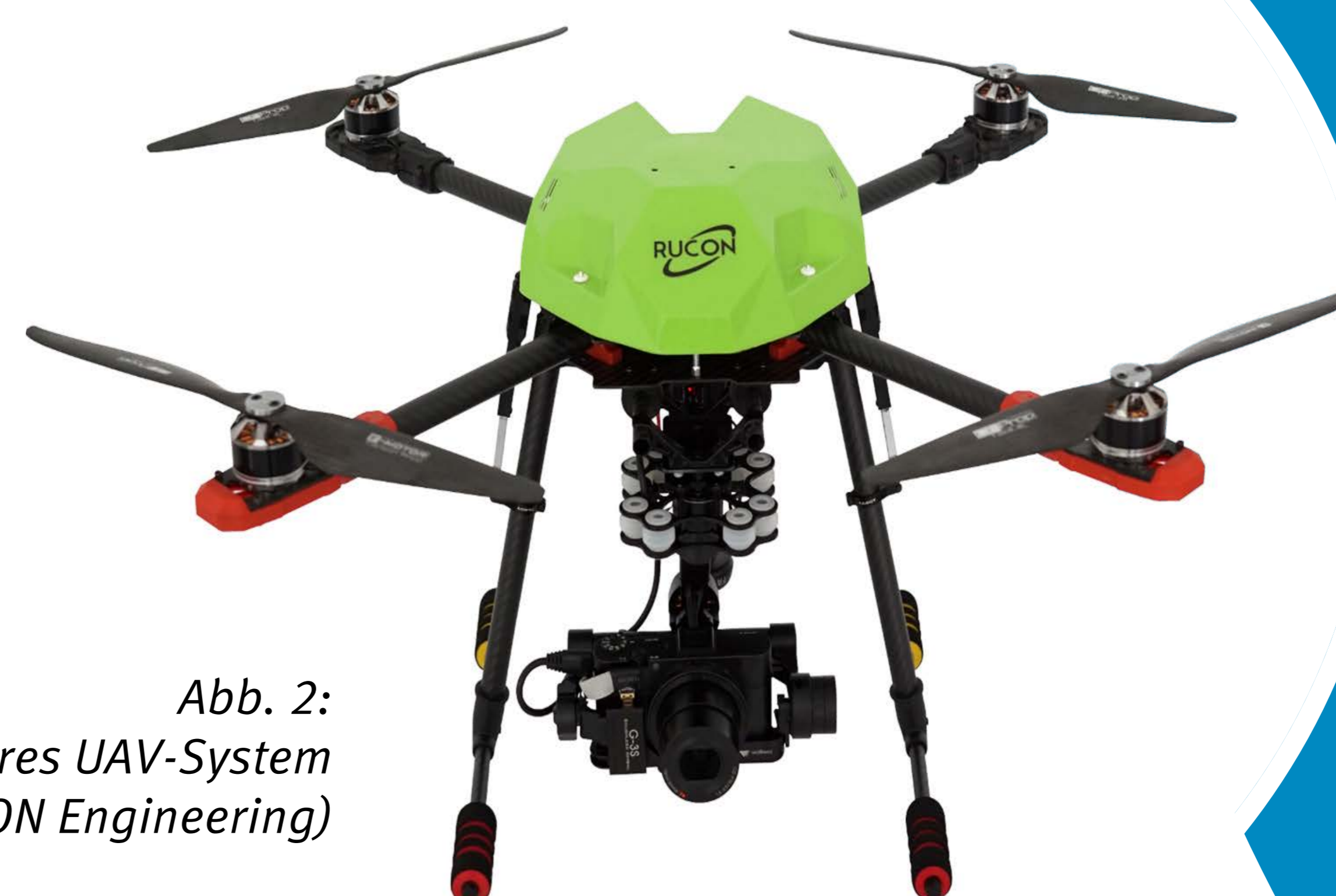
Abb. 2: Modulares UAV-System

Ergebnis 4: Modul C (Aktormodul 2 – Wildtierversreibung – akustischer und optischer Aktor) sowie die erforderliche Software zur automatischen Realisierung von Missionen.