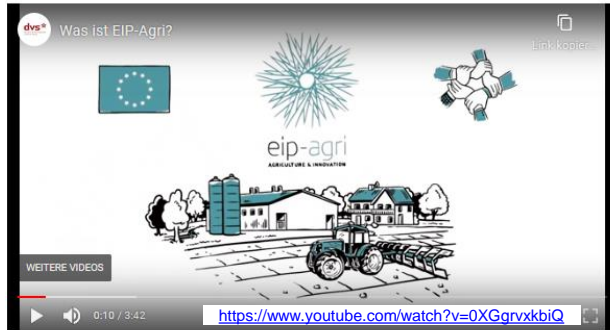
Was ist EIP-Agri? Video der Deutschen Vernetzungsstelle Ländliche Räume