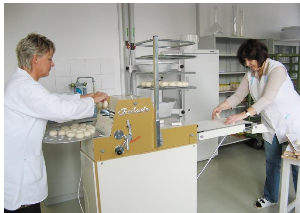
Bestimmung der Backqualität von Weizenmehlen im standardisierten Backversuch an der LLG in Bernburg

Die Liste der arbeitsteilig zu analysierenden, speziellen Untersuchungsparameter wird entsprechend neuer gesetzlicher Untersuchungsanforderungen ständig angepasst. Im Bereich der amtlichen Kontrolle von unerwünschten Stoffen in Futtermitteln wird der Wirkstoff Hydroxymethylfurfural ausschließlich im Labor des TLLLR in Jena untersucht. Im Bereich der Pflanzenschutzmittelrückstandskontrolle in Pflanzen und Ernteprodukt sowie Bodenproben erfolgt eine arbeitsteilige Analyse der Wirkstoffgruppen Glyphosat/ Ampa in der BfUL Nossen und der Dithiocarbamate (gemäß Rückstandsdefinition) im TLLLR Jena. Auf die Untersuchung der Kontaminationen von Boden-, Klärschlamm und Kompostproben mit Perfluorierten Tensiden (PFT) hat sich die BfUL Nossen spezialisiert. Im Gegenzug erfolgt die Analyse der Glucosinolate in Raps, Rapsextraktionschrot und Senfesaat ausschließlich im TLLLR. Weitere arbeitsteilig durchgeführte Spezialuntersuchungen sind in den Bereichen der Saatgut- und Getreidequalitätsuntersuchung, der Bodenphysik, der Analyse von speziellen Futtermittelzusatzstoffen sowie Futterwertparametern sowie der Ultraspurenanalytik von Tierarzneimittelrückständen in Futtermitteln und Wirtschaftsdüngern angesiedelt.