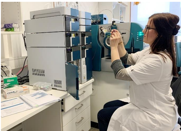
Organische Rückstandsanalyse im Ultraspurenbereich mittels hochauflösender Massenspektrometrie an der BfUL in Nossen

Auch im Jahr 2021 beeinflusste die COVID-19-Pandemie den Umfang der durchgeführten Untersuchungen in allen drei Bundesländern, insbesondere durch Einschränkungen bei der Probenahme. Die meisten Proben der arbeitsteiligen Kooperation entfielen auf den Bereich der Qualitätsprüfungen von Ernteprodukten. So wurden durch die LLG für die BfUL 196 Proben und für das TLLLR 120 Proben auf Produktqualität untersucht.